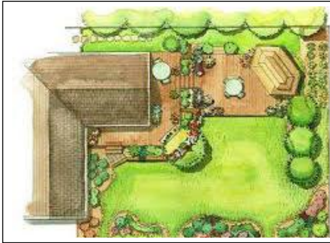
Pelan tapak landskap