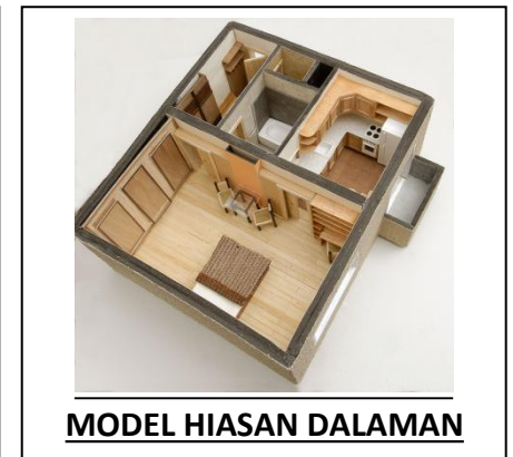
MODEL HIASAN DALAMAN