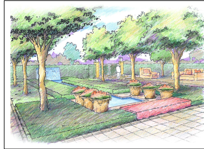
Pelan perspektif landskap